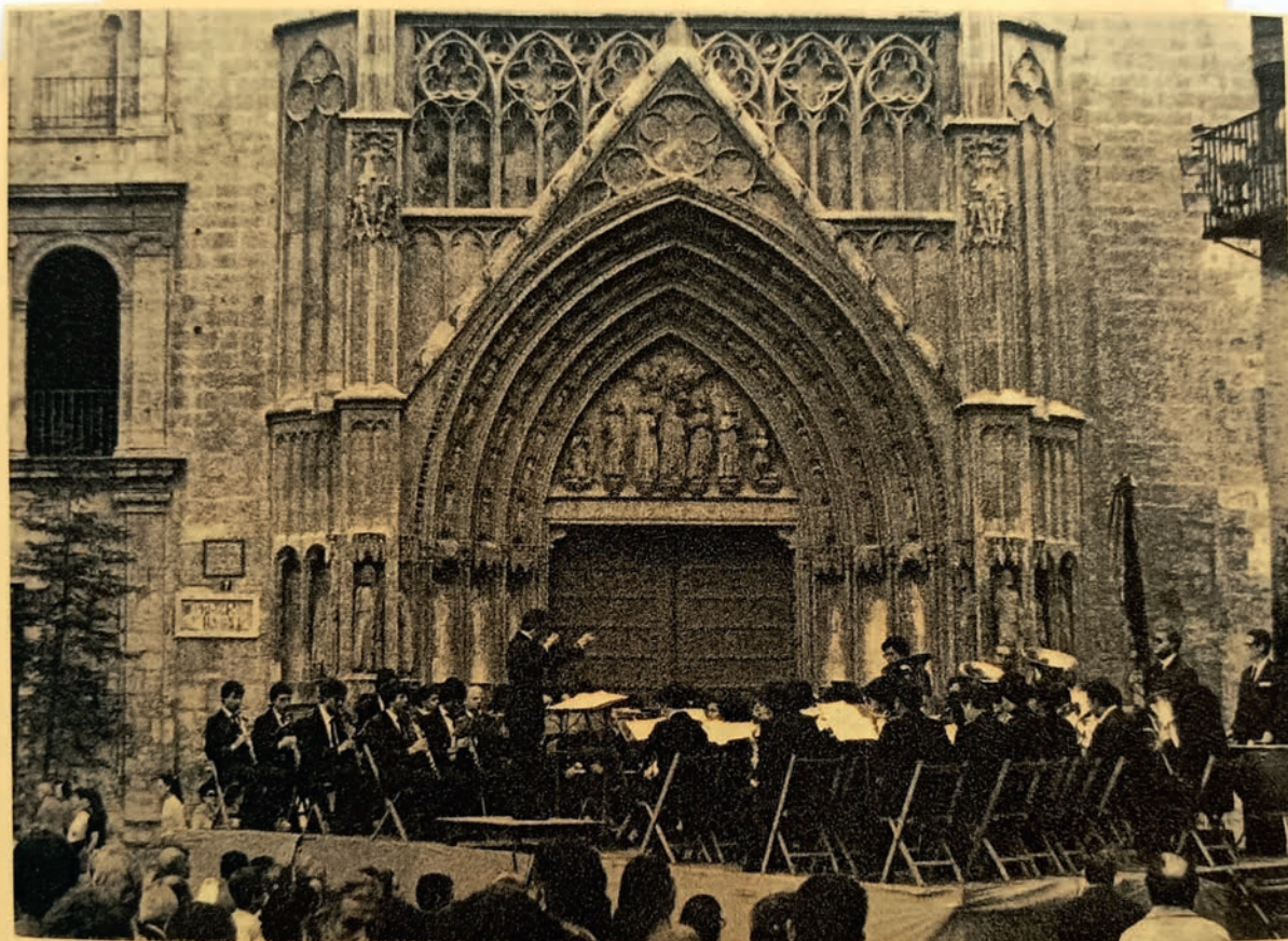
Arreglo recorte tipo Primatón

En una cuatricromía se hacía un arreglo por cada cliché fotograbado (CMYK).