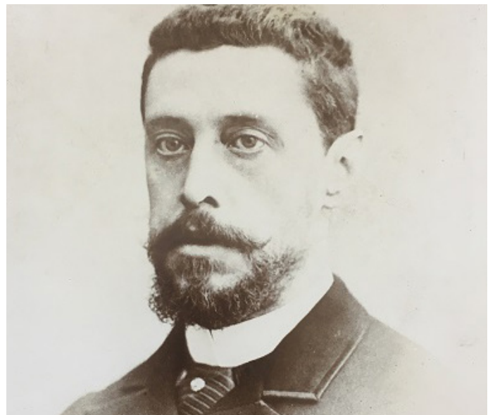
Serrano Morales: gran divulgador de la historia de la imprenta valenciana

Texto y fotografías: Enrique Fink Hurtado