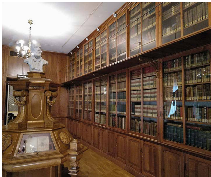
Interior del Palau de Cervelló, sede de la Biblioteca Serrano Morales

Durante 2021 nuestra Asociación colocará en el Museo una vitrina dedicada a Serrano Morales en justo reconocimiento al gran erudito y estudioso de nuestra imprenta.