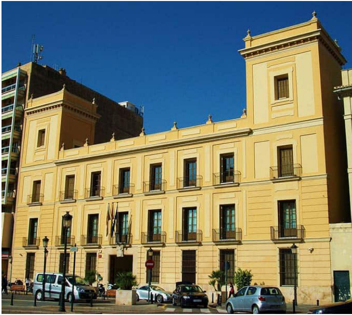
Exterior del Palau de Cervelló, sede de la Biblioteca Serrano Morales