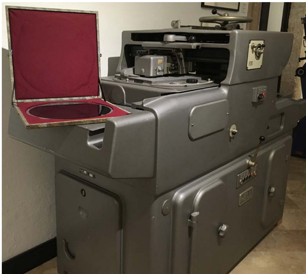
Fotografía Vario Klischograf Museo de la Imprenta de Enrique Fink